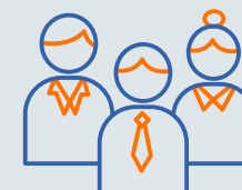
SCHRITT 6 Eintragung beim Registergericht