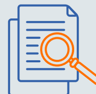
SCHRITT 5 Gründungsprüfung