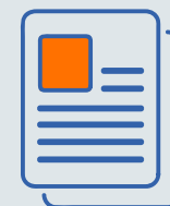
SCHRITT 3 Satzung festlegen