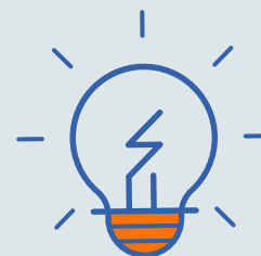
SCHRITT 1 Idee für Genossenschaft