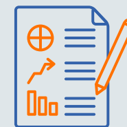
SCHRITT 2 Geschäftsplan aufstellen