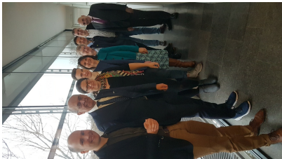
Parlamentarisches Frühstück mit Abgeordneten der Bündnis90/Die Grünen Landtagsfraktion.