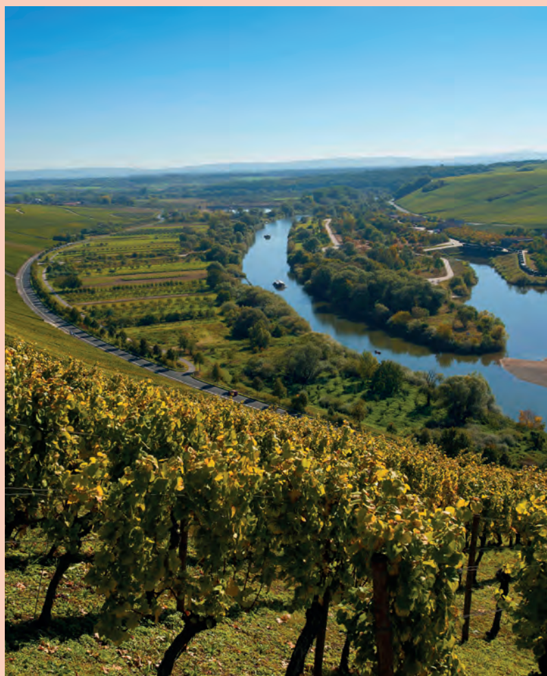
Fränkische Weinberge.

Über die Qualität des Frankenweins – insbesondere jenem der fränkischen Winzergenossenschaften – müssen längst keine Worte mehr verloren werden. Wo man ihn dagegen stilvoll kaufen und verköstigen kann, zeigt der exklusive „Profil-Wein-atlas“.